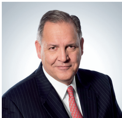
Przewodniczący Rady Dyrektorów i Dyrektor Generalny

W United Technologies łączą nas nasze podstawowe wartości. Wartości te oznaczają, że postępujemy uczciwie i traktujemy każdego pracownika, klienta oraz dostawcę z zaufaniem i szacunkiem. Uczciwe postępowanie oznacza również przestrzeganie wszelkich przepisów prawa, zasad i regulacji. W tym roku wdrażamy ponownie Kodeks etyki firmy UTC, aby skupić się na wartościach służących za fundament naszej kultury: zaufaniu, uczciwości, szacunku, innowacyjności i doskonałości.